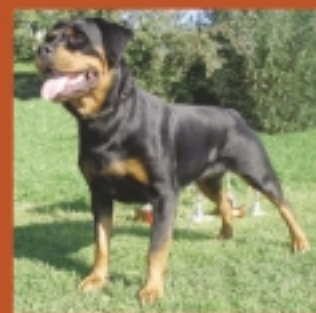
Jaana Estampa Negra

Veškeré informace o našich RTW, aktuality, fotografie naleznete na webových stránkách chovatelské stanice www.terezskydvur.cz design a některé fotografie od: www.lucieskopalova.com