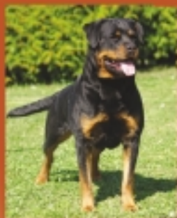
Rizza Earl Antonius

Nabízí štěňata po velmi úspěšných rodičích Interšampioni, multišampioni, kluboví, národní vítězové multi CAC-CACIB-BOB, zkoušky z výkonu, zdravotní vyšetření oba rodiče možno vidět v naší chovatelské stanici Aktuální nabídka štěňat po Dack Flash Rouse a matkách